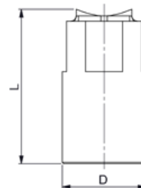
FB4LC (LARGE CAPACITY)